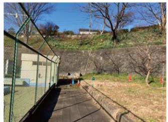
⑤北側擁壁・既存緑地