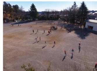
⑦グラウンド(現在の校舎より見下ろす)