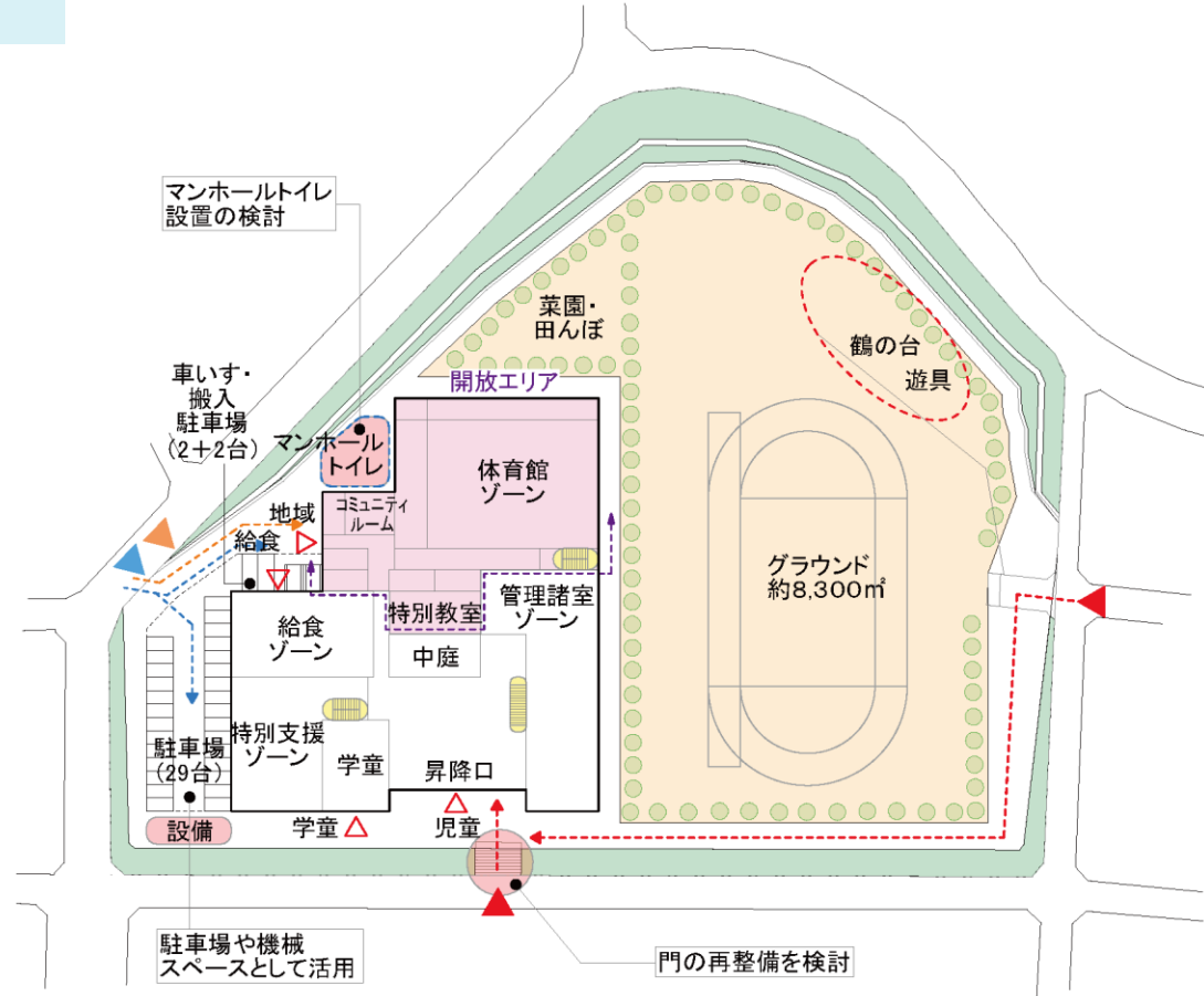
■地域開放エリアの使い方・動線/外構計画