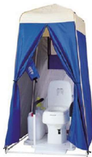
マンホールトイレイメージ