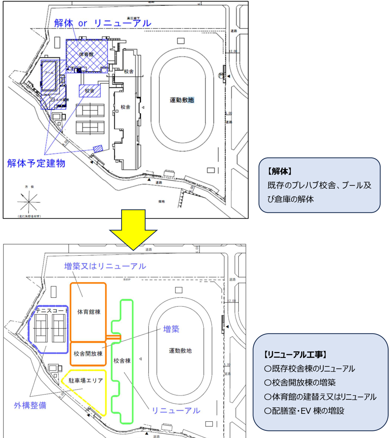
図 リニューアル工事のイメージ図

新しい時代の学びを実現する学習・生活空間と地域活用型学校としての機能を持つ校舎を整備すると共に、既存校舎の長寿命化（又は機能回復）及び省エネルギーに配慮した施設整備を行う。