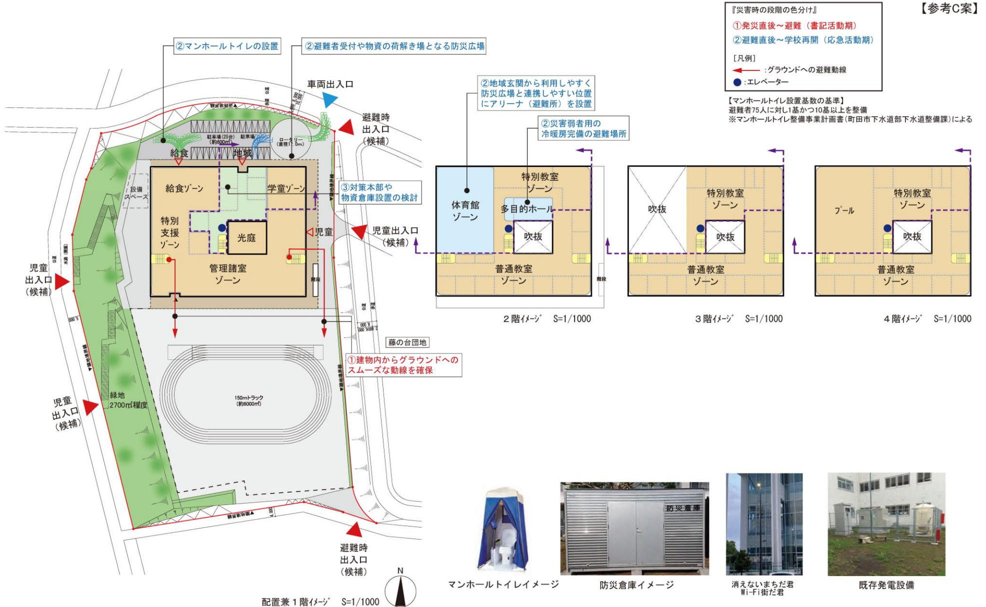
■配置・平面計画案について 防災計画検討(案)