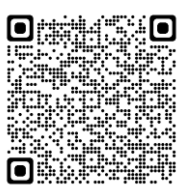
南成瀬地区の検討状況