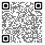
南第二小学校と南成瀬小学校の学校統合、仮校舎への通学及び在校生の学区外通学制度等について（パンフレット）