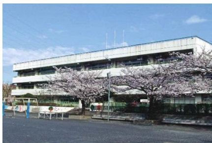
第2・4回会場：南第二小学校