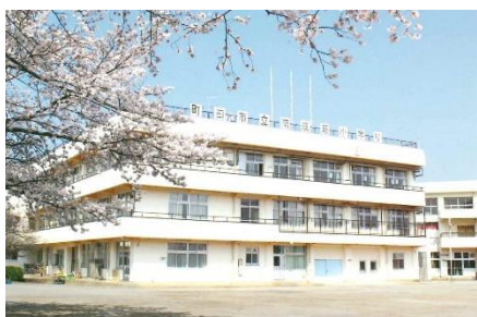
第1・3回会場：南成瀬小学校