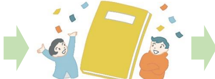
新たな学校づくり 推進計画をつけた