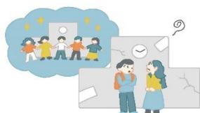
少子化と学校の 老朽化が進む

少子化によりクラス替えができない学校がでてきていることや、深刻な学校施設の老朽化などの課題に対応するため、学校統合を含む通学区域の見直しを契機として、より良い教育環境を目指した計画※を策定しました。保護者や地域住民、みんなで協力して新たな学校をつくっていきます。