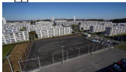
各種スポーツに利用できる緑ヶ丘グラウンド

民間とのコラボレーションを含む様々な 活用方法によって、新たな価値や魅力が 生まれているね！