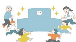
みんなでつろう！ 新たな学校