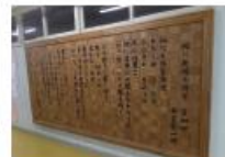
第108回卒業生 詩の木影り