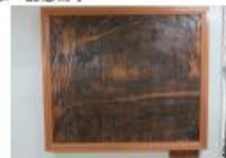
第103回卒業生 木影り画