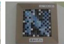
2017年卒業生 モザイクタイル画