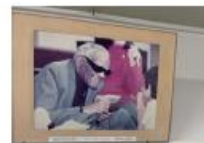
レイ・チャールズ写真