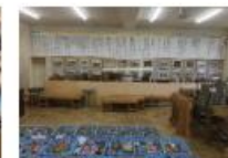
展示室 (学校年表、昔の写真)