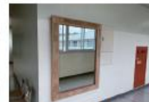
第106回卒業生 木影り枠の籠