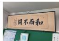
和而不同 文部大臣 奥野誠亮