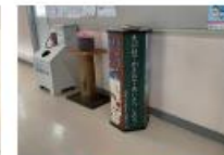
平成24年度卒業生 道案内の柱