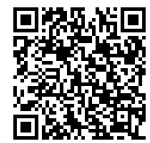
【検討会の進捗状況】

第1回 2022年5月9日 済 第4回 2022年9月12日 第2回 2022年6月20日 第5回 2022年10月24日 第3回 2022年8月1日 第6回 2022年12月19日