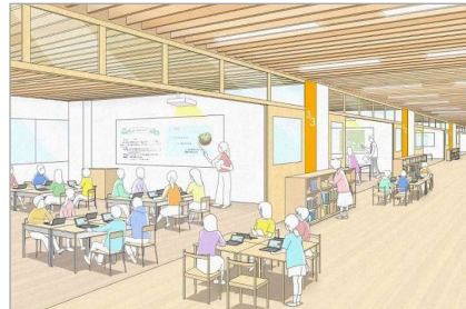
図 地域とともに育つ学校（地域の活動拠点としての学校）