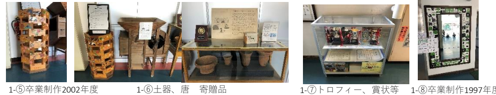
1-⑤卒業制作2002年度 1-⑥土器、唐 寄贈品 1-⑦トロフィー、賞状等 1-⑧卒業制作1997年度