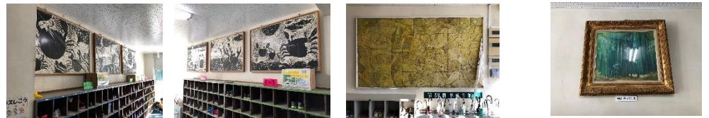
1-⑨版画×6枚 (詳細不明) 1-⑩卒業制作レリーフ 3 9回卒業生 1-⑪平本和生寄贈