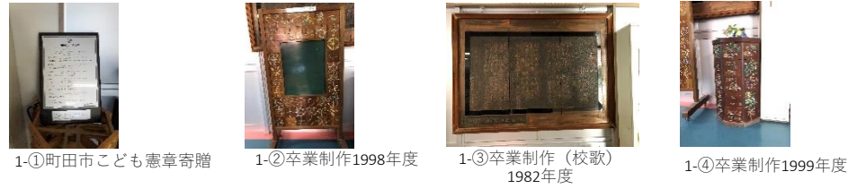
1-①町田市こども憲章寄贈 1-②卒業制作1998年度 1-③卒業制作 (校歌) 1982年度 1-④卒業制作1999年度