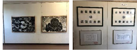
3-①版画×2枚 (詳細不明) 3-②平本和生寄贈