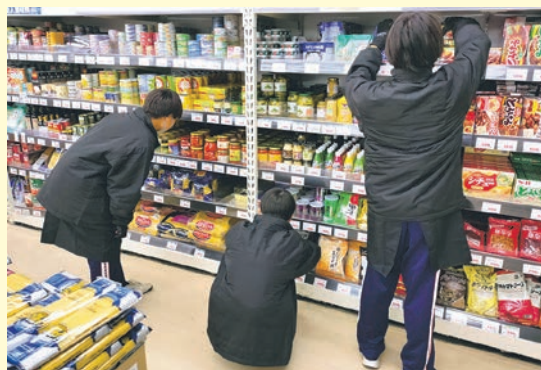
スーパーで品出し・検品を体験する中学生

職場体験は、地域の皆様のご理解とご支援により成り立っています。より一層のご協力をお願いします。