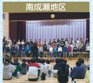
南成瀬地区 連合音楽会の合唱披露