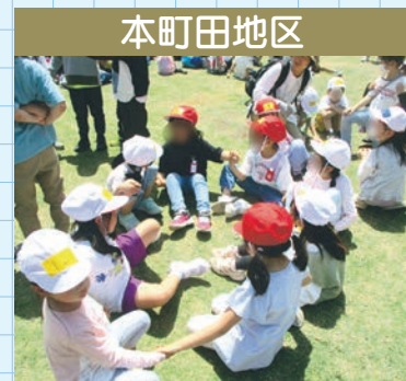
本町田地区 薬師池公園への合同遠足

児童同士が顔見知りや友達になったうえで学校の統合ができるよう、本町田地区の本町田東小学校と本町田小学校、南成瀬地区の南第二小学校と南成瀬小学校では児童の交流を進めています。