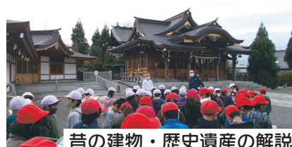
昔の建物・歴史遺産の解説