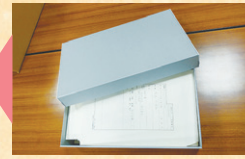
年代順等に並べ替え 中性紙保存箱に収納