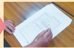
中性紙封筒へ封入し 封筒に情報を記入