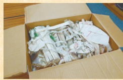
持ち込まれた古文書

古文書・歴史資料は1点ずつ整理し、一定の温湿度の収蔵庫内に保管することで、史料の劣化が進まないようにしています。