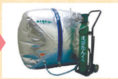
二酸化炭素燻蒸 (殺虫・殺卵処理)