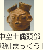
中空土偶頭部 愛称「まっくう」

町田市は都内でも有数の遺跡がある地域です。縄文時代を中心に約200点の考古資料が展示されている考古資料室について、学芸員がわかりやすく解説しています！