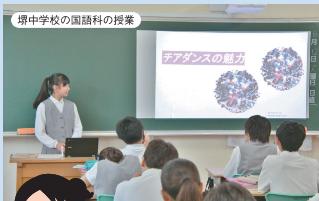
堺中学校の国語科の授業

自分でテーマを選んで、調べた内容や伝えたいことをまとめ、写真や動画を使いながら発表を行っています。