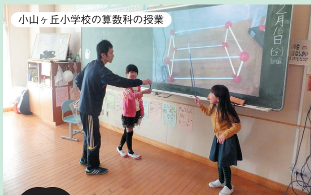
小山ヶ丘小学校の算数科の授業

授業では、画像や文章を黒板に大きく映し、重要な部分に線を引いたり、文字を書き込んだりして、教員と子ども、または子ども同士で共有しています。