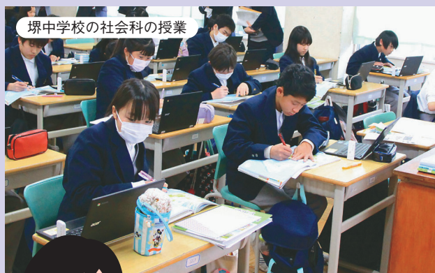
堺中学校の社会科の授業

一人ひとりがタブレットを使って、ドリル学習に取り組んでいます。間違った問題については、繰り返し学習を行い、基礎学力の定着につなげています。