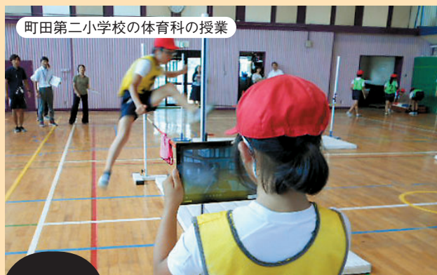
町田第二小学校の体育科の授業

運動している姿を友達と撮影し合い、お互いのフォームの確認や、動きのポイントについて話し合い、フォームの改善につなげています。