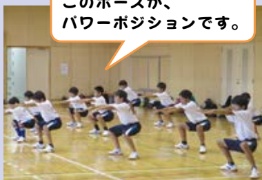
このポーズが、パワーポジションです。