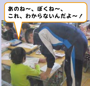
あのね～、ぼくね～、これ、わからないんだよ～！