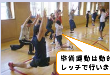
準備運動は動的ストレッチで行います。