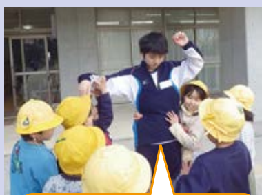
ねえ、ねえ～おにいちゃんあそぼうよ～！ いいよ～!!