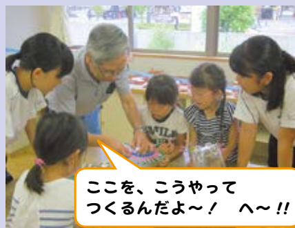
ここを、こうやってつくるんだよ～！ へ～!!