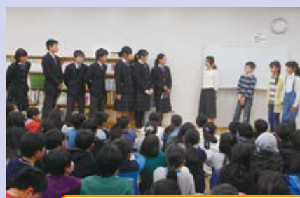
小学生のみなさん！今日は私たちが企画して中学校紹介をしました！みなさんの入学をお待ちしています！