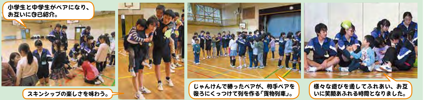
小学生と中学生がペアになり、お互いに自己紹介。 スキンシップの楽しさを味わう。 じゃんけんで勝ったペアが、相手ペアを後ろにくっつけて列を作る「貨物列車」。 様々な遊びを通してふれあい、お互いに笑顔あふれる時間となりました。

金井中学校の家庭科の授業の一環で、金井中学校の3年生と金井小学校の1年生が交流する機会をもちました。一緒に様々な遊びを楽しみ、中学生にとっては、小さな子どもたちとの関わり合い方を学ぶ、小学生にとっては、大人に見えるお兄さん、お姉さんに関わる貴重な時間となりました。