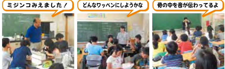
ミジンコみえました！ どんなワッペンにしようかな 骨の中を音が伝わってるよ