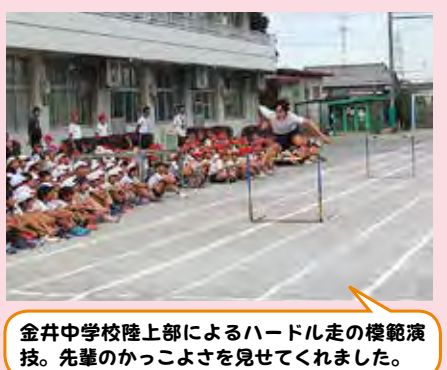
金井中学校陸上部によるハードル走の模範演技。先輩のかっこよさを見せてくれました。

昨年度から、金井小学校と藤の台小学校の高学年の児童が、学校対抗と一緒に運動会を行っています。金井中学校の陸上部員も参加し、模範演技を披露したり、リレーを一緒に行ったりして交流を図っています。