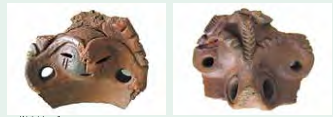
▲顔面把手の内側(左)と外側(右)。把手の高さは12.7cm。

この遺跡は原町田二丁目は都賀住宅建替えに伴い、1985～86年に発掘されました。遺跡からは、縄文時代中期(約5000年前)の集落跡の一部が見つかっています。主な遺構は竪穴住居跡12軒、掘立柱建物跡2棟などで、土器や石器が多数発見されました。注目されたのが、土器の装飾の一部である「顔面把手」です。下の写真2枚は、実は同じ土器片の裏表です。左が土器の内側で可愛らしい面相に、刺青を表現したような線が面目の下に2本ずつあります。右は土器の外側で鼻息の荒い獣の顔面に見えます。前者が女、後者が男、土器本体は新しい命を生み出す「特別製の入れ物」、そんな縄文神話に關係した重要な造形ではないかと考えられます。