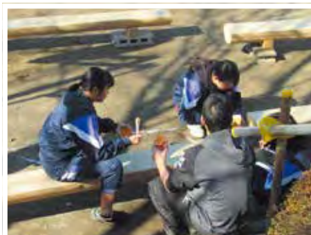
▲保育園で、ベンチにニスを塗る