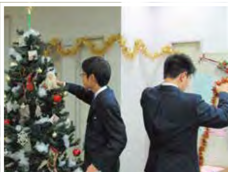
▲公共施設で、季節の飾り付けを行う

今年度は、市内667の事業所にご協力をいただき、3,611人の生徒が職場体験を行いました。子どもたちにとって大きな自信、財産となる貴重な体験をありがとうございました。