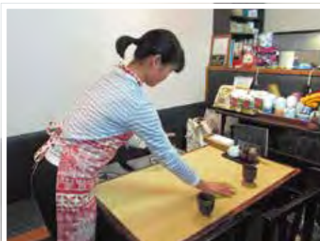
▲飲食店で、テーブルを片付ける