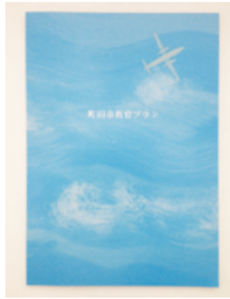
▶町田市教育プランの表紙

町田市教育委員会では、2009年に策定した「町田市教育プラン」を改定し、第2期目となる計画を策定しました。この町田市教育プランは、町田市教育委員会の教育目標と基本方針を受け、それを実現するために取り組む施策を示したものです。今後、町田市教育プランに掲げる施策を推進し、更なる教育の充実を目指していきます。市民の皆さまには、引き続き町田市の教育へのご協力・ご支援をいただきますようお願いいたします。