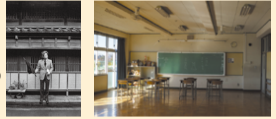
左上から時計回りで 「翁」(「観世清河寿の能」より) 「若い人」(「小説のふるさと」より) 「町田文学散景」より 「五木寛之」(「昭和の肖像」より)

会期中、オープニングイベント、対談&トークショー、映画上映会等の 関連イベントを実施します。詳しくは、町田市民文学館ことばらんど まで問い合わせ、または町田市ホームページをご覧ください。