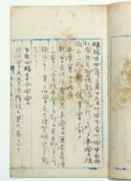
大成会「記事録」 冒頭に「原町田中宿秋間氏 宅耶蘇教講義所」とある。

その史料は、町田村の青年 結社大成会(すぐ辛卯会に 改称)の活動記録で、こ の結社は現町田地区の青 年たちが定期的に集い、 演説や討論をする学習結 社でした。演題・論題に は実業・地域振興・行動 規範などが取り上げられ