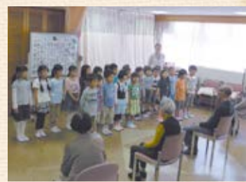
▲デイ・サービスとの交流

七夕交流、昔遊び、デイ・サービスを訪問しての直接交流、行事への招待、高齢者擬似体験、クリスマス会など、デイ・サービスに通所されているお年寄りの方との交流を通して、思いやりの心を育てています。