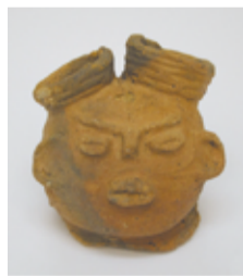
▲中空土偶頭部 現存高7.2cm 縄文時代後期 (約3300年前)

この文化財は、今からおよそ3300年前(縄文時代 後期)の人形の呪術具で、小山町の田端東遺跡の発掘 調査で1988年に出土しました。現存高は7.2cm、厚さは 3mm程度しかありません。内部は全て空洞で、頭頂部 には太い円筒状の髪結び表現が2本あります。また、顔面 は眉と鼻をつなげたT字形の表現と、コーヒー豆のよ うな両目に特徴があります。この様式は、北海道函館市 の国宝「中空土偶」と同じですが類例が少なく、頭部の 残り具合は国宝より優れていることから、2014年1月、町 田市指定有形文化財に指定されました。