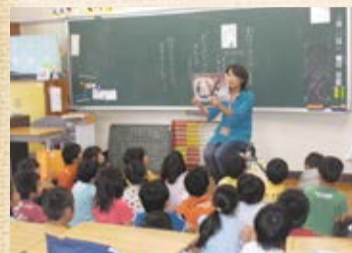
▲保護者による読み聞かせ

年間2回の読書旬間では、「読書貯金」「おはなしバイキング」など、児童が本に親しめるように様々な取組を実施しています。また、毎週金曜日の朝読書や保護者サークル「おはなしタンポポ」による月2回の読み聞かせも大切な時間です。