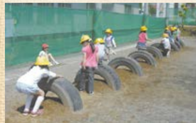
▲体育部が整備した遊具を使って遊ぶ

ます。さらに、本校は一校一取組における「なわ跳び集会」や校庭管理のきめ細かな環境整備など、体育部を中心とした組織的な運営が児童の体力向上を支えています。