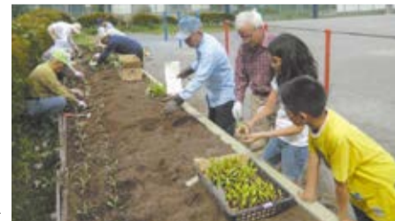
小山長寿会と栽培活動▶

小山小学校は、長年の地域の方々による学校支援活動が認められ、文部科学大臣表彰を受賞しました。 同校では、町田市学校支援センターのバックアップの下、地域農業従業者等の支援を受け、校内でお米や野菜の栽培、蚕の飼育、搾乳体験、谷戸の自然観察など様々な取組を継続的に行っていました。 今後も地域の方々と連携・協力し、地域とともにある学校として、教育活動を推進していきます。