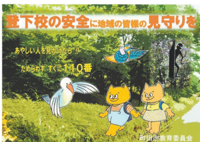
▲児童・生徒の見守りを市民に呼びかけるポスター

今年6月に、都内の小学生児童が、下校時に校地外で不審者に襲われるという事件が発生したことをうけ、町田市教育委員会では、市立小中学校で作成している「不審者対応マニュアル」を見直し、登下校時についても対応を行っています。