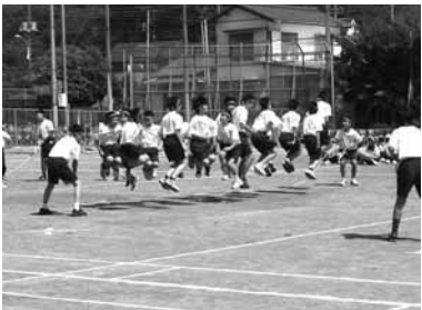
▲堺中学校体育祭の様子

選抜リレー、学年種目などが行われ、迫力ある演技や競技に惜しめない拍手が送られました。 10月には、秋の運動会として、小学校9校で行われる予定です。