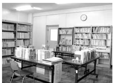
▲教科書展示室の様子

（森野 1-33-10） ○開館日は期間中の月、火、木、金、日曜日（水、土曜日は休館日） ※会場により開館日が異なりますのでご注意ください。 ※森野分庁舎会場では日曜日にも開館いたします。 ※中学校教科用図書の採択は8月7日（金）午前10時市役所森野分庁舎で開催する教育委員会定例会の場で行う予定です。