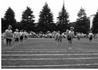
▲鶴川第三小学校運動会の様子

小学校では、32校で行われ、大玉送り、紅白リレー、組体操、綱引きなどの種目で大きな拍手や歓声があがりましました。 中学校では、全20校で開催され、100m、1500m、