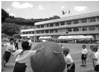
▲大戸小・武蔵岡中の合同運動会

また、小学校でも中学校でも、PTAや地域の方々、卒業生などが参加する競技や教職員が出場する種目なども工夫され、白熱した勝負が繰り広げられました。