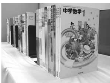
▲中学校教科用図書