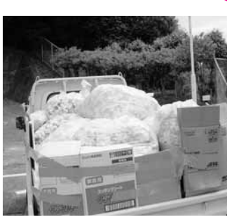
▲エコキャップで世界にワクチンを

この環境教育に積極的に取り組んでいる学校の中から、町田市立小山田小学校の取り組みについて紹介します。