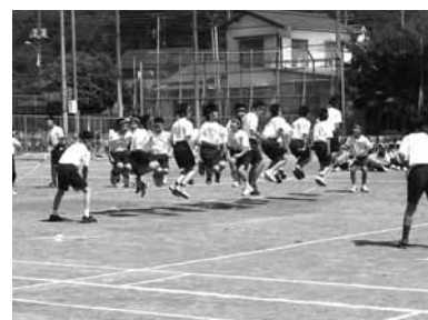
▲堺中学校体育祭の様子

選抜リレー、学年種目などが行われ、迫力ある演技や競技に惜しめない拍手が送られました。 また、小学校でも中学校でも、PTAや地域の方々、卒業生などが参加する競技や教職員が出場する種目なども工夫され、白熱した勝負が繰り広げられました。 6月7日には、地域型小・中一貫教育モデル校にも指定されている大戸小学校と武蔵岡中学校の両校が、町田市初の小中学校合同の運動会を開