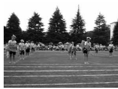
▲鶴川第三小学校運動会の様子

町田市立小・中学校全61校のうち52校で、5月から6月にかけて、春の運動会・体育祭が開催されました。 小学校では、32校で行われ、大玉送り、紅白リレー、組体操、綱引きなどの種目で大きな拍手や歓声があがりました。 中学校では、全20校で開催され、100m、500m、