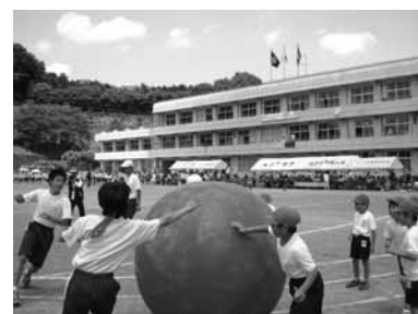
▲大戸小・武蔵岡中の合同運動会