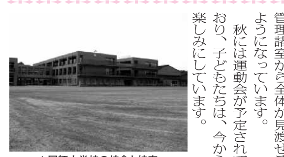
▲図師小学校の校舎と校庭