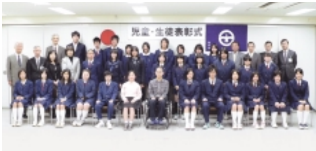
表彰受賞者（敬称略）

町田市教育委員会では、様々な活動の場において一生懸命努力している児童・生徒を応援するため、その活躍や努力に対し表彰を行っています。