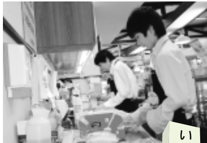
木曾中学校生徒職場体験の様子

町田市教育委員会では、今年度市立全中学校の2年生約3000人を対象に職場体験事業を実施します。