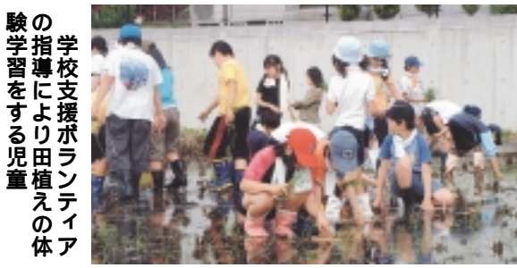
学校支援ボランティアの指導により田植えの体験学習をする児童

このことから、教育委員会では、今年5月に特別支援教育の理念と基本的な考え方を広く理解・共有していただけるよう、特別支援教育のパンフレットを作成し、小・中学校と幼稚園の教職員、保護者に向けて45000部配布しました。 今後、教育委員会では、通常の学級におけるLD等を含めた障がいのある児童・生徒への指導や支援のあり方について、専門家や巡回指導員を派遣して学校を支援する取り組みを一層進めてまいります。 一方、国の動向を見据えつつ、既存の固定学級(知的、情緒、肢体)及び通級指導学級(情緒、弱視、難聴、言語)の充実も図ってまいります。 現在、各小・中学校では、校内