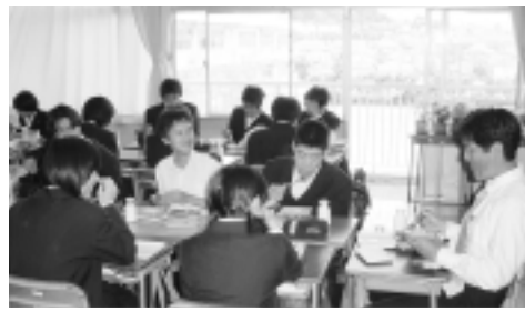
楽しく給食する風景(つくし野中学校で)

中学校の給食については、弁当併用外注給食方式により、昨年の9月から志生・堺地区の4校で実施していますが、この5月15日より、南地区の南中、つくし野中、成瀬台中、南成瀬中学校で新たに開始しました。5月分の給食申し込みは、新規開始4校の平均で47・7%、昨年開始の4校を含めた8校平均では47・2%でした。