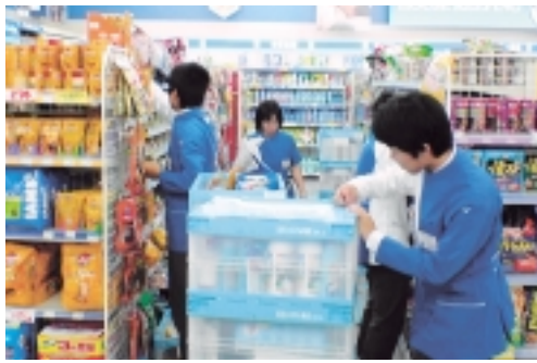
「町田っ子」は、いきいき活動します。

最近フリーターやニートなどと呼ばれ定職に就かない青少年の増加や、地域社会の人間関係の希薄化、青少年の社会参加意欲の低下などが懸念されています。 このような状況の中で、身近な大人が真実に働く姿を目のあたりで見ることで、子どもたちの「生きる力」を育て、また子どもたちが個々の「生き方」を見つめる契機となることを目的としています。教育委員会では、町田市立全中学校の2年生約3000人を対象に9月に連続5日間、地域で働く職場体験事業を実施します。