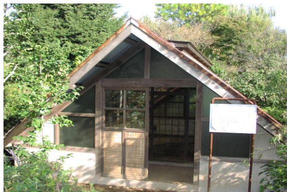
【国指定史跡 高ヶ坂石器時代遺跡】