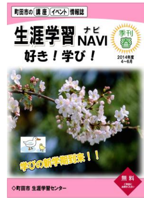
『生涯学習NAVI 好き！学び！』

市民が生涯学習を行う際に役立つように、町田市の講座・イベント情報誌『生涯学習NAVI 好き！学び！』を発行し、市内の公共施設で無料配布しています。