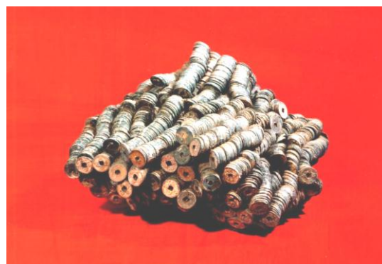
【町田市指定有形文化財 能ヶ谷出土銭（約1万枚の古銭）】