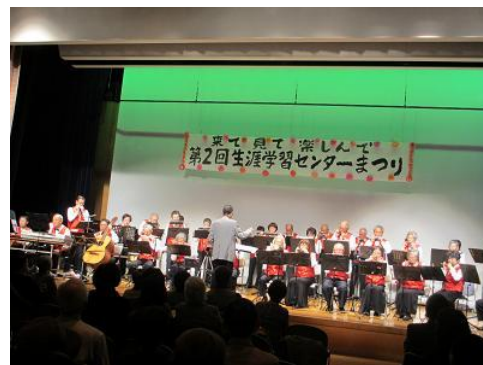
第2回(2013年度)生涯学習センターまつり

2013年度に開催した第2回生涯学習センターまつりでは、展示の部27団体、発表の部29団体が参加しました。