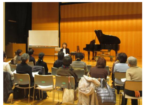
生涯学習ボランティアバンク体験講座

市民がより充実した生涯学習活動が行えるよう、様々な知識や技術、経験をもち、地域社会に役立てたいと考える市民又は団体と、身近な学習活動を通じて知識や技術を習得したいと希望する市民団体等の橋渡しをしています。また、この制度をより多くの方に利用してもらえるよう、定期的に体験講座を実施しています。