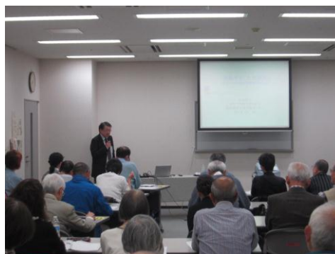
現代の人間を科学する(講座風景)