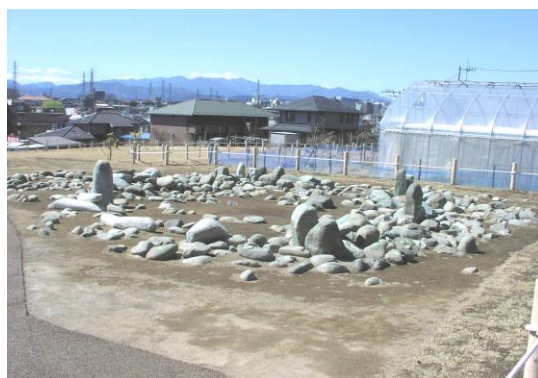
【東京都指定史跡 田端環状積石遺構】