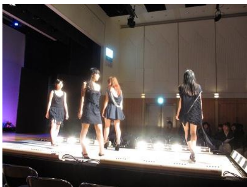
ファッションイベント「まちコレ」 (大学・専門学校、民間企業連携)

また、町田市と相模原市の行政と、2市を生活圏とする地域の大学、NPO法人、企業などが連携し設立された「公益社団法人 相模原・町田大学地域コンソーシアム（通称：さがまちコンソーシアム）」の事業を活用し、幅広いテーマの講座等を実施しています。2014年度は、「さがまちカレッジ町田市連携講座」として、「家庭でできる！ハーブのレシピ」や「一瞬で内容が伝わる案内状、報告書のレイアウト術」など、学びの楽しさを実感し、学んだことを生活に活かせるような学習講座を開催します。さらに、東日本大震災の被災地でボランティア活動を行っている学生団体による学生活動報告会「東北復興ボランティア展」を開催し、市民にボランティアの役割や可能性を伝えます。