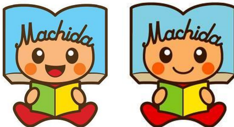
町田市立図書館キャラクター「よむぼん」

第二次町田市子ども読書活動推進会議は、第二次町田市子ども読書活動推進計画を効果的に推進するため2011年度に設置されました。委員は市民の代表9人と行政で関係する4課長、図書館長の14人で構成されています。市民と行政が一緒に委員として協議するのが特徴です。この会議では、第二次計画の進捗状況の検証に関すること、総合調整に関すること、第二次計画の推進に係る情報交換及び連携に関することを行っています。