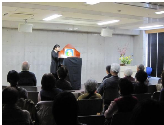
紙芝居・大人の時間