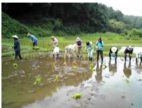
まちだ de エコ・ツアー(農業体験)

市民大学受講後には、修了生が任意で学習サークルを立ち上げて学びを継続しています。2014年8月現在、51の修了生団体が活動しています。