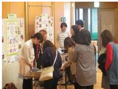
学生活動報告会 (さがまちコンソーシアム連携)