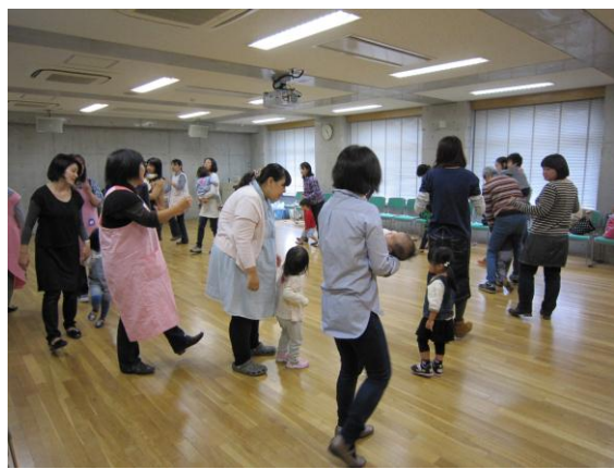
2歳児あつまれ!四季をあそぼ!