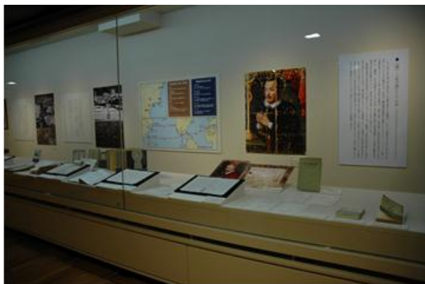
遠藤周作『侍』展－“人生の同伴者”に出会うとき