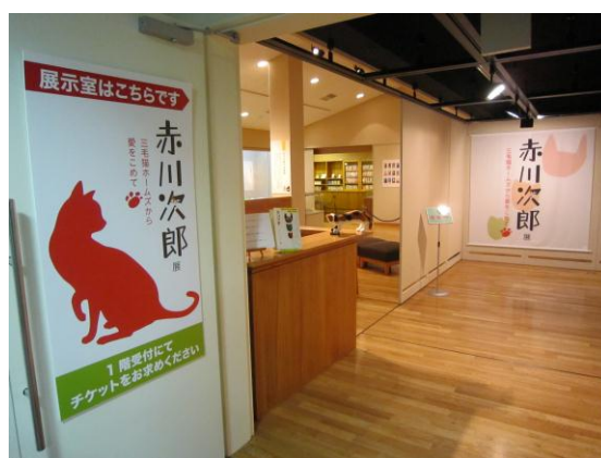
赤川次郎展－三毛猫ホームズから愛をこめて