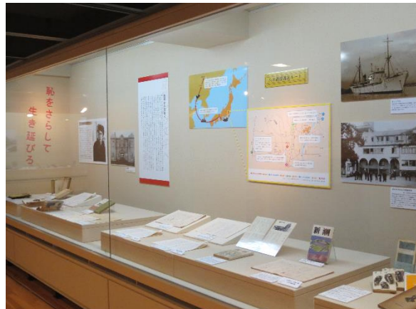
「世界の果てで生き延びろ—芥川賞作家・八木義徳展」