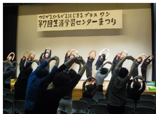
第7回(2018年度)生涯学習センターまつり

2018年度に開催した第7回生涯学習センターまつりでは、展示の部19団体、発表の部25団体、ワークショップの部2団体が参加しました。