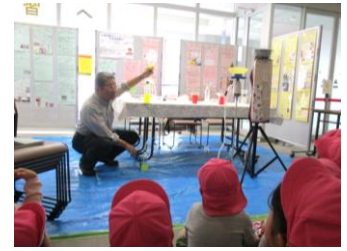
生涯学習ボランティアバンク 一日体験講座

市民がより充実した生涯学習活動が行えるよう、様々な知識や技術、経験をもち、地域社会に役立てたいと考える市民又は団体と、身近な学習活動を通じて知識や技術を習得したいと希望する市民団体等の橋渡しをしています。また、この制度をより多くの方に利用してもらえよう、定期的に体験講座を実施しています。