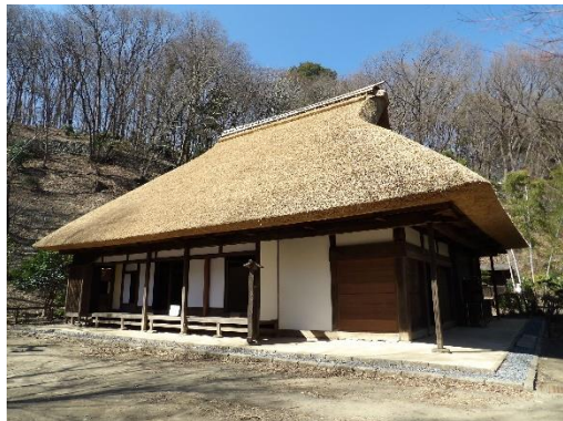
【東京都指定有形文化財 旧荻野家住宅】