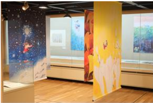
「みつはしちかこ展—恋と、まんがと、青春と—」