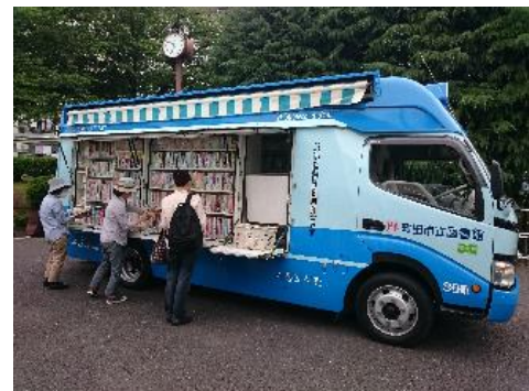
2018年度 移動図書館利用者数・巡回数

図書館が身近にない地域に対して図書館サービスを継続的に提供するため、3台の移動図書館「そよかぜ号」が2週間に1回、65か所のサービスステーション（さるびあ図書館から2台で43か所、堺図書館から1台で22か所）を巡回しています。