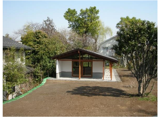
【国指定史跡 高ヶ坂石器時代遺跡】