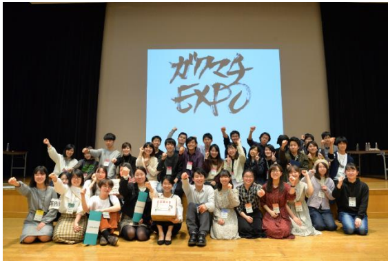
学生活動報告会「ガクマチEXPO」 (さがまちコンソーシアム協力)