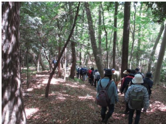
自然講座(野外実習風景)

市民大学受講後には、修了生が任意で学習サークルを立ち上げて学びを継続しています。2019年6月現在、44の修了生団体が活動しています。