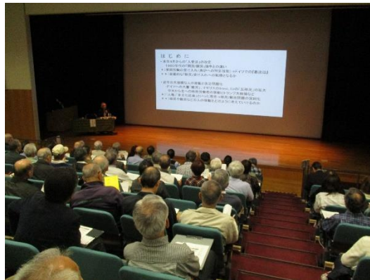
まちだ市民国際学(講義風景)