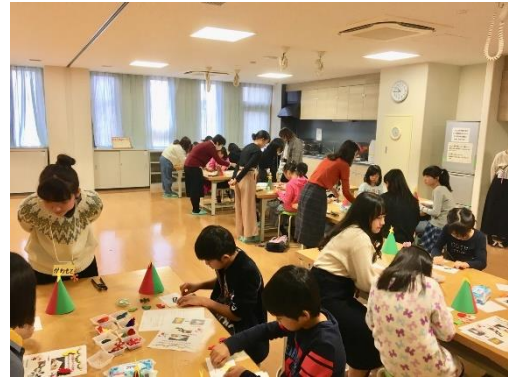
さがまちカレッジ 子どもセンターただ ON 共催 【こども体験講座】クリスマス飾りを作ろう