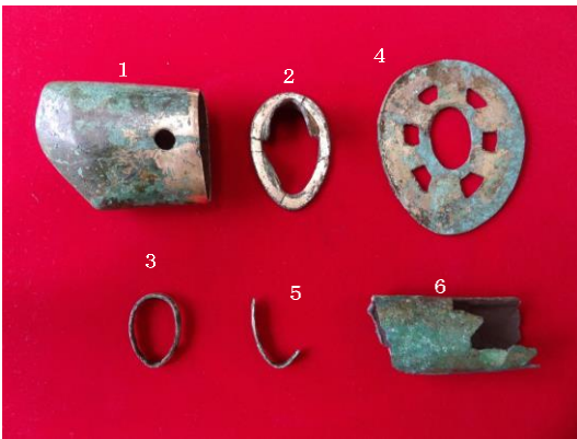
【町田市登録有形文化財 西谷戸横穴墓群出土圭頭大刀】