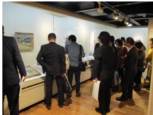
「八木重吉－さいわいの詩人－」展