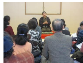
生涯学習ボランティアバンク

市民がより充実した生涯学習活動が行えるよう、様々な知識や技術、経験をもち、地域社会に役立てたいと考える市民又は団体と、身近な学習活動を通じて知識や技術を習得したいと希望する市民団体等の橋渡しをしています。また、この制度をより多くの方に利用してもらえよう、定期的に体験講座を実施しています。