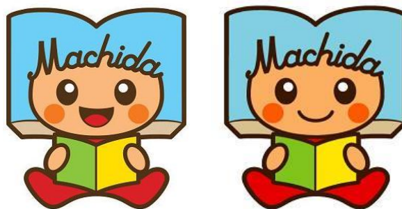
町田市立図書館キャラクター「よむぼん」

町田市子ども読書活動推進計画推進会議は、「町田市子ども読書活動推進計画」を効果的に推進するため設置されている会議です。会議は市民の代表9人と、市の関係部門4課の課長、図書館長の14人で構成されており、市民と行政と一緒に委員として協議するのが特徴です。この会議では、計画の進捗状況の検証に関すること、総合調整に関すること、計画の推進に係る情報交換及び連携に関することを行っています。