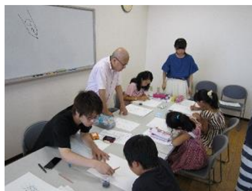
さがまちカレッジ 「まんが」っておもしろい！！ 作ってみよう！自分なりの キャラクター！！