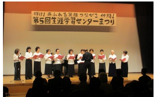
第5回(2016年度)生涯学習センターまつり

2016年度に開催した第5回生涯学習センターまつりでは、展示の部19団体、発表の部24団体、ワークショップの部3団体が参加しました。