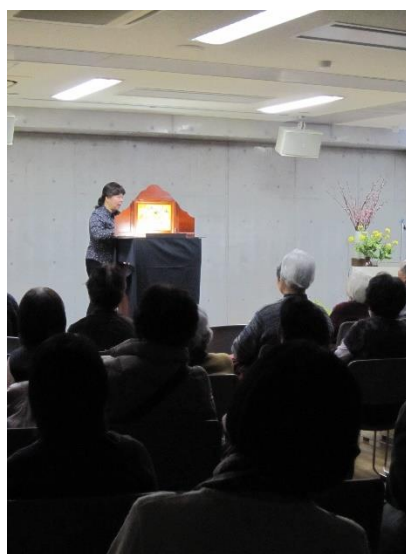
紙芝居・大人の時間