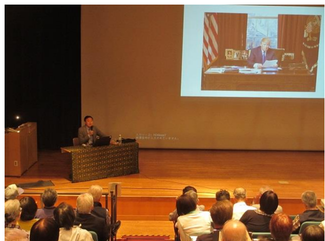
まちだ市民国際学(講義風景)