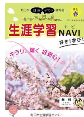
『生涯学習NAVI 好き！学び！』

市民が生涯学習を行う際に役立つように、町田市の講座・イベント情報誌『生涯学習NAVI 好き！学び！』を発行し、市内の公共施設で無料配布しています。