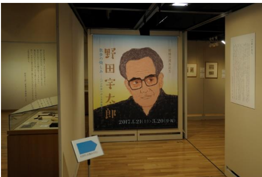
「野田宇太郎 散歩の愉しみ －＜パンの会＞から文学散歩まで－」展