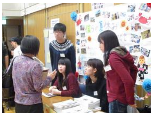
学生活動報告会「ガクマチEXPO」 (さがまちコンソーシアム協力)

また、町田市と相模原市の行政と、2市を生活圏とする地域の大学、NPO法人、企業などが連携し設立された「公益社団法人 相模原・町田大学地域コンソーシアム（通称：さがまちコンソーシアム）」と連携し「学生活動報告会」や、幅広いテーマの講座等を実施しています。2017年度は、「さがまちカレッジ町田市連携講座」として、「毎日みつける素敵な私ーおしゃれは心のサプリメントー」や「感じて描いてリラックスーークリニカルアトー」、「大人の食育～アンチエイジングのための料理教室～」など、学びの楽しさを実感し、学んだことを生活に活かせるような学習講座を開催します。