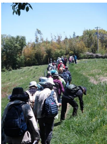
多摩丘陵の自然入門(野外実習風景)

市民大学受講後には、修了生が任意で学習サークルを立ち上げて学びを継続しています。2017年6月現在、44の修了生団体が活動しています。