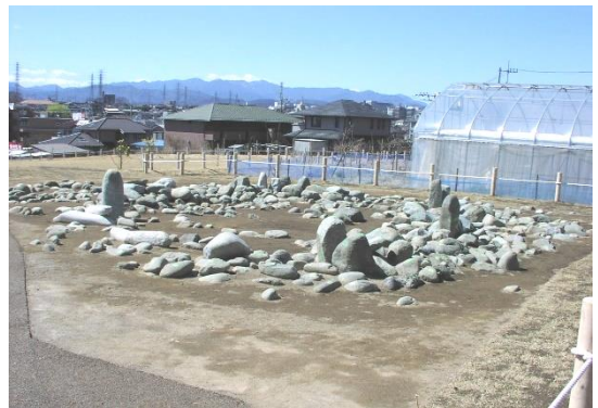
【東京都指定史跡 田端環状積石遺構】