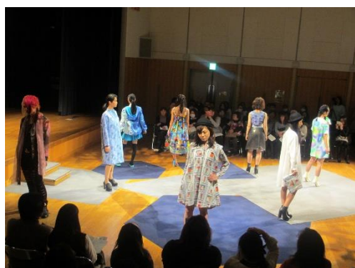
ファッションイベント「まちコレ」 (大学・専門学校、民間企業連携)

また、町田市と相模原市の行政と、2市を生活圏とする地域の大学、NPO法人、企業などが連携し設立された「公益社団法人 相模原・町田大学地域コンソーシアム（通称：さがまちコンソーシアム）」の事業を活用し、幅広いテーマの講座等を実施しています。2016年度は、「さがまちカレッジ町田市連携講座」として、「メタボ&ロコモ予防講座」や「感じて描いてリラックス『クリニカルアート』」、「ワンショット・ムービーをつくろう～発見される私とあなたの物語～」など、学びの楽しさを実感し、学んだことを生活に活かせるような学習講座を開催します。