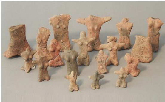
【町田市指定有形文化財 土偶一式（忠生遺跡出土）】