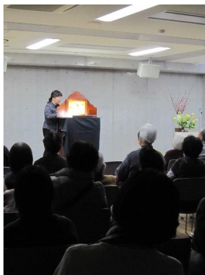
紙芝居・大人の時間