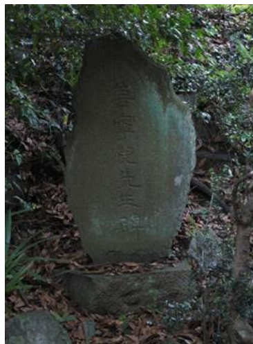
【町田市登録有形文化財 善寧児先生碑（通称 ジェンナー碑）】