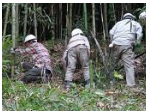
まちだ de エコ・ツアー(実習風景)

市民大学受講後には、修了生が任意で学習サークルを立ち上げて学びを継続しています。2016年8月現在、44の修了生団体が活動しています。