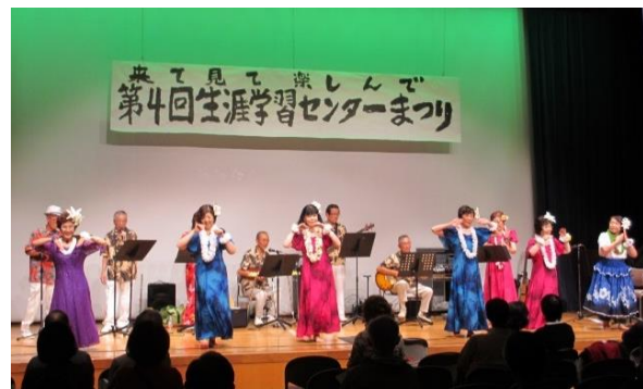
第4回(2015年度)生涯学習センターまつり

2015年度に開催した第4回生涯学習センターまつりでは、展示の部20団体、発表の部27団体が参加しました。