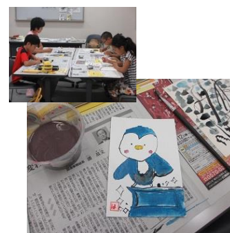
生涯学習ボランティアバンク

市民がより充実した生涯学習活動が行えるよう、様々な知識や技術、経験をもち、地域社会に役立てたいと考える市民又は団体と、身近な学習活動を通じて知識や技術を習得したいと希望する市民団体等の橋渡しをしています。また、この制度をより多くの方に利用してもらえよう、定期的に体験講座を実施しています。