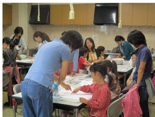
さがまちカレッジ 「身近な植物でTシャツを染めよう」