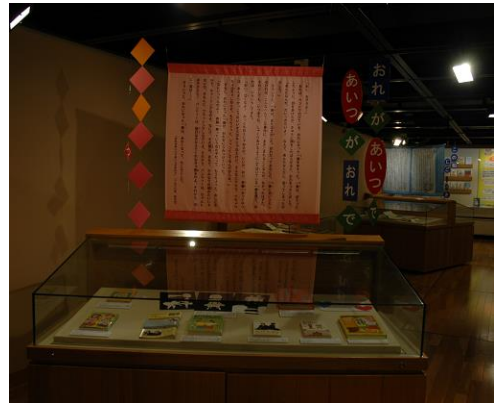
「児童読物作家・山中恒－子どもと物語で遊ぶ」展