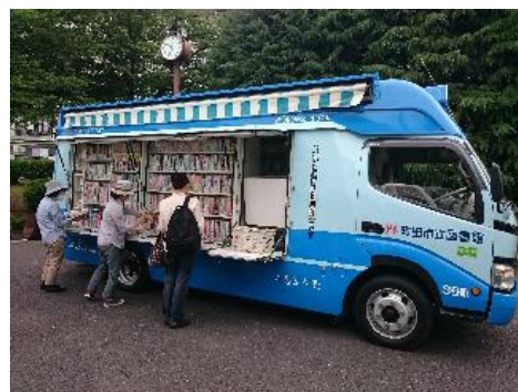
2015年度 移動図書館利用者数・巡回数

図書館が身近にない地域に対して図書館サービスを継続的に提供するため、3台の移動図書館「そよかぜ号」が2週間に1回、65か所のサービスステーション（さるびあ図書館から2台で43か所、堺図書館から1台で22か所）を巡回しています。