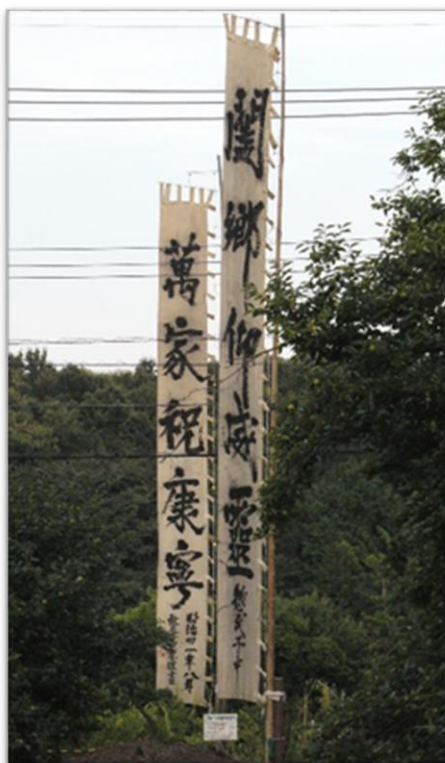
【町田市登録有形文化財 野津田神社幟（石阪昌孝揮毫）】