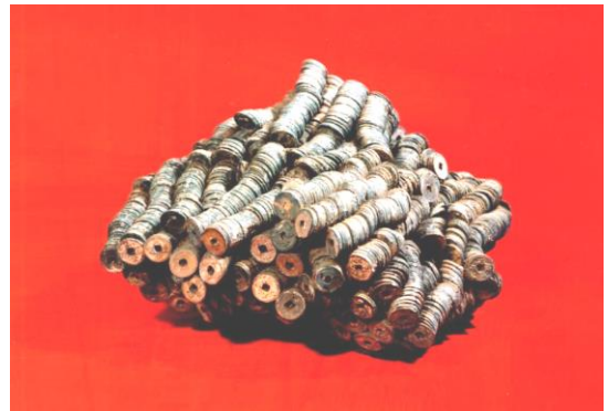
【町田市指定有形文化財 能ヶ谷出土銭（約1万枚の古銭）】