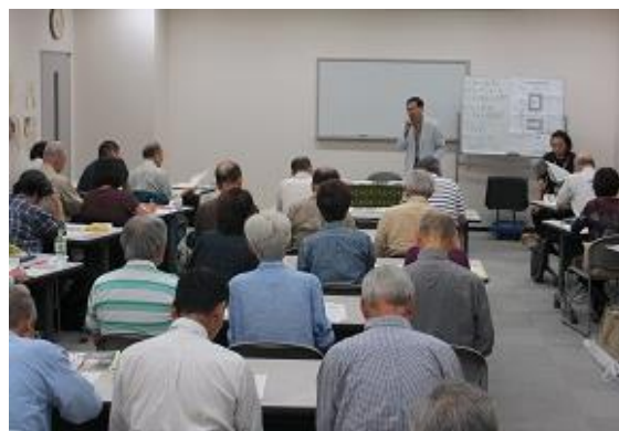
町田の郷土史(講義風景)