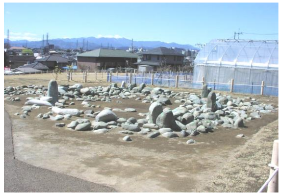
【東京都指定史跡 田端環状積石遺構】