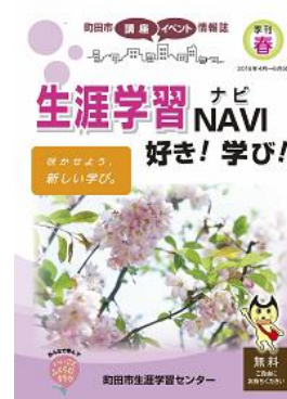
『生涯学習NAVI 好き！学び！』

市民が生涯学習を行う際に役立つように、町田市の講座・イベント情報誌『生涯学習NAVI 好き！学び！』を発行し、市内の公共施設で無料配布しています。