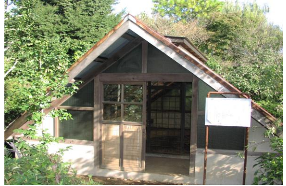
【国指定史跡 高ヶ坂石器時代遺跡】