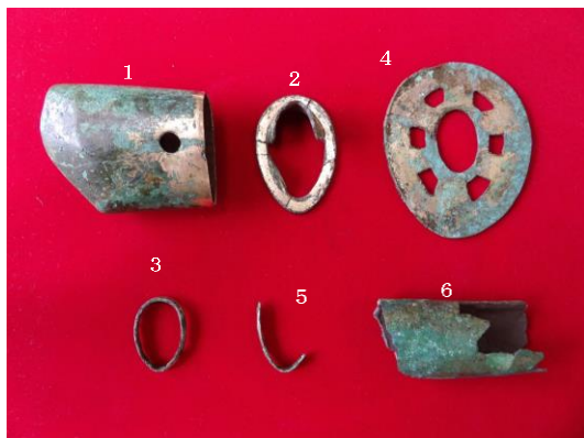
【町田市登録有形文化財 西谷戸横穴墓群出土圭頭大刀】