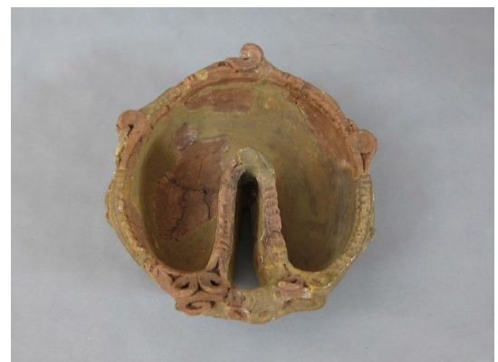
【町田市指定有形文化財 クルミ形土器（木曾中学校遺跡出土）】