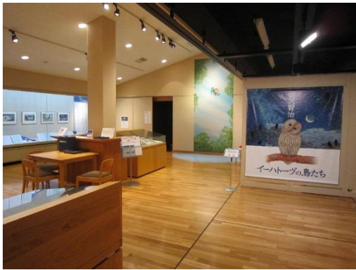
「宮沢賢治 イーハトーヴの鳥たち」展