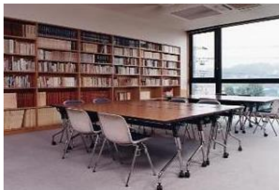
自由民権資料館閲覧室

さらに、資料館の前身の市史編さん室が収集した町田の歴史に関わる資料、周辺地域の各自治体史や歴史書なども同時に収集し、閲覧できる体制を整えています。