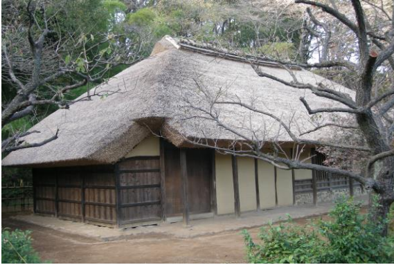
【国指定重要文化財 旧永井家住宅】