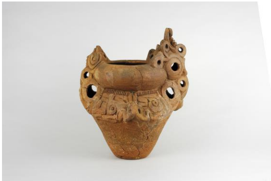
【町田市指定有形文化財 深鉢形土器（忠生遺跡出土）】