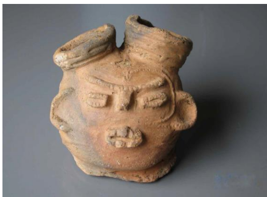
【町田市指定有形文化財 中空土偶頭部（田端東遺跡出土）】