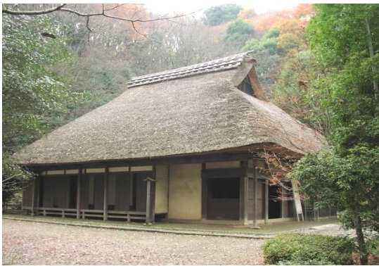
【東京都指定有形文化財 旧荻野家住宅】