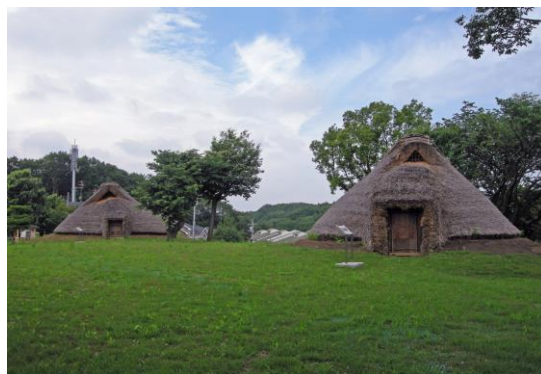
【東京都指定史跡 本町田遺跡】