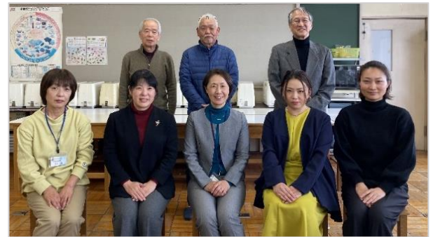
南第一小学校 新たな学校づくり基本計画推進協議会 2023年度委員の皆さん