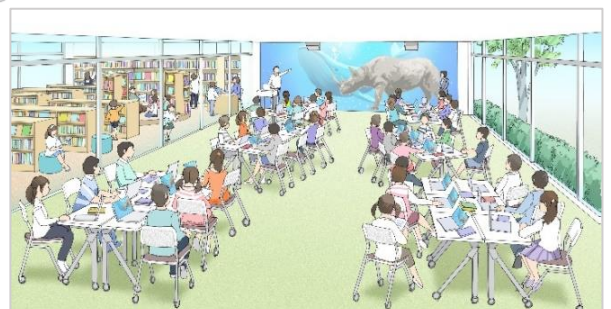
ラーニングセンター

ホワイトボードなら板書も投影もできて便利だね。オープンスペースがあると教室を広く使えてグループワークがやりやすいな！ ラーニングセンターでみんなと一緒に大画面で映像をみながら勉強がしたい！