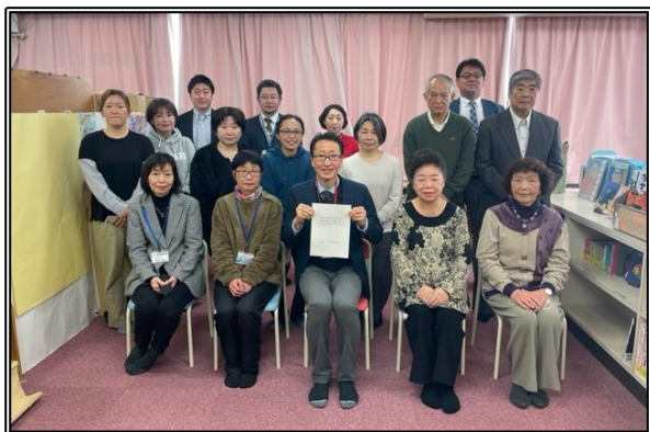
本町田地区新たな学校づくり基本計画検討会委員の皆さん

報告を踏まえて教育委員会では、本町田地区の新たな学校づくりを具体的かつ計画的に進めるために「町田市本町田地区新たな学校づくり基本計画」を2022年度内に策定し、春ごろに説明会を開催する予定です。