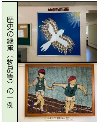
歴史の継承（物品等）の一例

南第二小学校・南成瀬小学校の歴史や伝統のうち、新たな学校に「何を」、「どのように」引き継いでいくか検討をしています。検討会での主な意見をご紹介します！