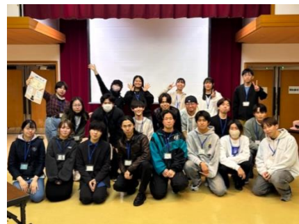
キックオフミーティングの様子