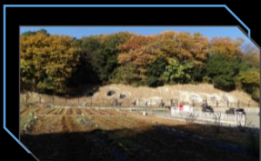
東京都指定史跡 西谷戸横穴墓群