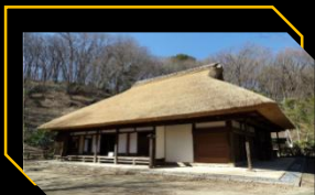
東京都指定有形文化財 旧荻野家住宅