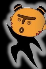
まちだ縄文キャラクター まっくろう