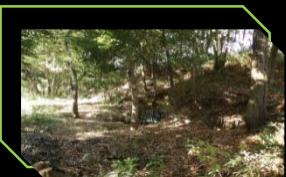
東京都指定史跡 下三輪玉田谷戸横穴墓群