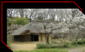
国指定重要文化財 旧永井家住宅