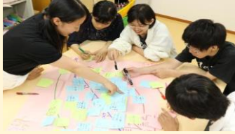
「町田創造プロジェクト(MSP)」

「町田創造プロジェクト (MSP)」 「子ども委員会」 「若者が市長と語る会」 など