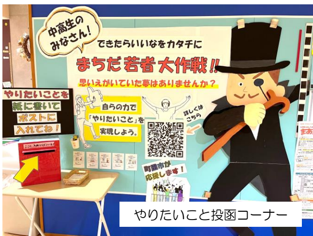
やりたいこと投函コーナー