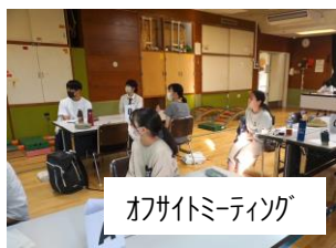
オフサイトミーティング