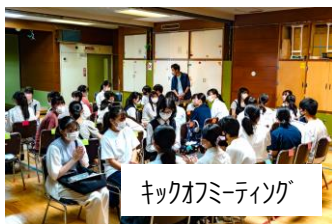
キックオフミーティング