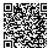
意見募集ホームページ

トップページ>子育て・教育>子育てに関する支援計画・事業 >町田市子ども発達支援計画行動計画～第二期障害児福祉計画 ～（2021年度から2023年度）