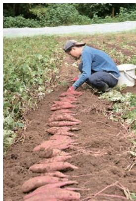
ひとつひとつ手作業で丁寧にサツマイモを掘り出します

ソルゴーというイネ科の植物を植え、米ぬかと一緒にすき込んで醗酵させることで土を良い状態にしています