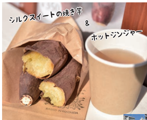
シルクスイートの焼き芋 & ホットジンジャー

キッチンカーで焼き芋を販売。3種類(紅あずま、紅はるか、シルクスイート)の焼き芋を楽しめます。この日は大蔵町のカフェビーンズファームとコラボしたシヨウガシロップで作るホットジンジャヤーも登場。夏には自家製シロップのかき氷を販売しています