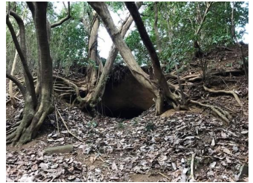
里山の中にある戦車壕跡

3月10日の東京大空襲は有名ですが、山の手地区には5月25日から26日にかけて空襲があり、小野路も被害を受けました。宿通りの真ん中で炸裂したアメリカ軍の焼夷弾は田畑や民家に飛び散り、小野路宿通りの10軒の家屋が焼失しました。万松寺の本堂で眠っていた疎開中の子供たちは、暗闇の中、岩子山まで裸足で逃げたと伝えられています。寺にあるカヤの木には被弾の跡が今も残り、蔵の奥に焼夷弾の鉄の筒を保管しているお宅もあります。