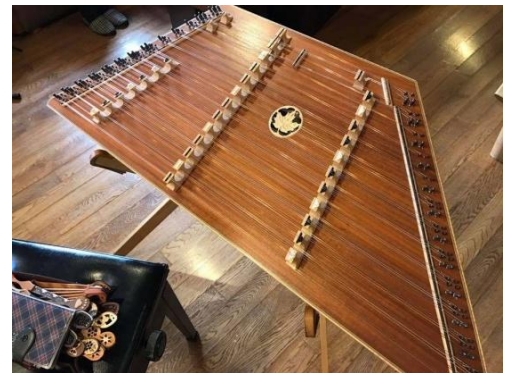
ハンマーダルシマー