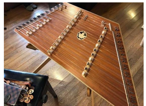
ハンマーダルシマー

内容：10世紀頃の中東に起源をもち、ピアノの原型とも言われている民族楽 器「ハンマーダルシマー」の演奏会を行います。 日時：5月26日（日曜日） 午後1時00分から午後2時30分まで 鑑賞費用：無料 ※直接、小野路宿里山交流館へお越しください。