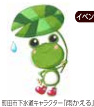
町田市下水道キャラクター「雨かえる」

イベント情報 成瀬グリーンセンターさくらまつり 3/30(土) 10:00~15:00 雨天3/31(日)に順延 下水道PR等 第6回恩田川なんでも写真展 3/23(土)・24(日)・30(土)・31(日) 成瀬弁天橋公園