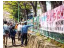
恩田川なんでも写真展