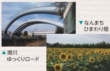
▼なんまち ひまわり畑

自転車歩行者専用道路「境川ゆっくりロード」では、水辺の鳥や川面を見ながらのんびりと進みましょう。ひまわりの畑やアーチ型の橋などフォトジェニックなスポットも。