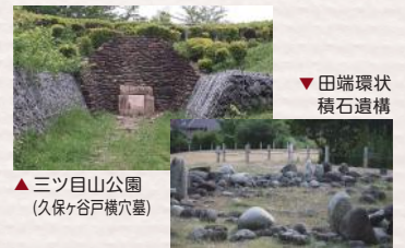
▼田端環状積石遺構

点在する寺社や遺跡を巡って、新しい街並みの中に残されたその土地の歴史に触れてみませんか。