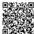
過去の認定商品はこちら

町田市内の中小企業者が生産する、新規性が高く優れた商品・サービスを市が認定し、認定事業者の販路拡大に向け、支援する制度です。 2013年度から始まり、多数の商品が認定されています。