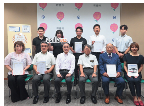
認定書交付式の様子 (2025年度)