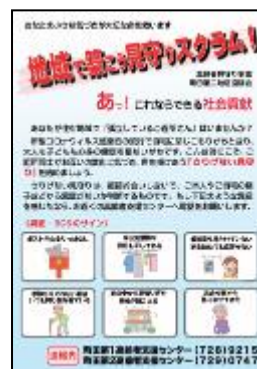
さりげない見守りチラシ

認知症高齢者の増加が見込まれるなか、認知症になっても住み慣れた地域で安心して生活を送れるよう、認知症を知り、町田市の認知症に関する取り組みを学ぶ、認知症講演会を開催しています。また、高齢社会と地域づくりについて意見交換を行っています。