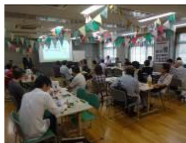
話してみる会・聞いてみる会

新たな担い手の発掘や地域住民（団体）のつながりの構築、原町田地区の住民から広く意見を聞き、今後の地区協議会の取り組み検討の参考とするため、「原町田について話してみる会・聞いてみる会」（ワークショップ）を開催しました。