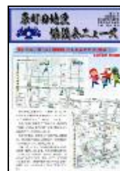
原町田地区協議会広報紙

原町田地区協議会の活動内容への理解促進や、地区内及び市内の地域社会づくりへの参加者を増やすため、原町田地区協議会ニュースの発行や原町田地区協議会活動状況紹介ポスターを作成しています。