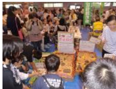
原町田ふれあいまつり

「原町田ふれあいまつり」を実施し、出展設営・運営やカレー作りを通して、参加団体相互の交流・親睦を深めました。