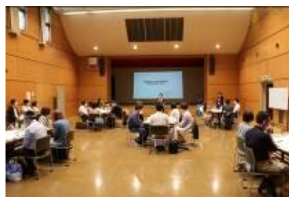
南あんしんプロジェクト

南地区内で様々な方を対象としている福祉関係事業所、団体等で構成されたメンバーで継続的に協議を重ね、各事業所・団体が抱えている課題や南地区の福祉に関する課題を洗い出し、解決に向けた活動を行っています。