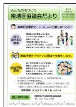
南地区協議会だより

地区協議会区域内の情報交流の促進や、南地区協議会について地区内の団体および住民への周知と理解を促進し、さまざまな地域社会づくりの活動の担い手を増やすため、「南地区協議会だより」の発行や活動周知のためのポスターを作成しています。