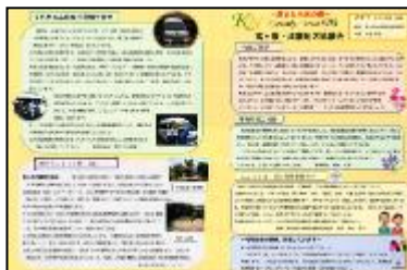
高ヶ坂・成瀬地区協議会広報紙

※他にも地域循環バス「くらちゃん号」、生活支援ボランティア「成瀬お助けたい」、新たな学びの場「小さなイエナスクールゆに〜く」など、様々な取組が行われています。