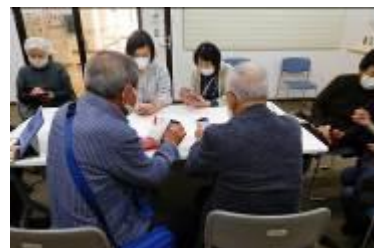
スマホ互助交流会

スマートフォンやLINE等のアプリケーションを使えるようになることによって、災害時の連絡や仲間づくり、コロナ感染拡大防止のためのWeb会議に役立てています。