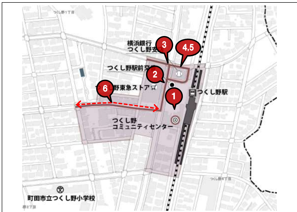
図3 事業位置（道路特定事業）