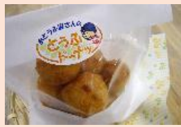
とうふドーナツ 200円