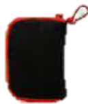
クッション ポーチ