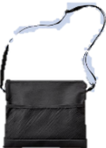
ショルダー バッグ